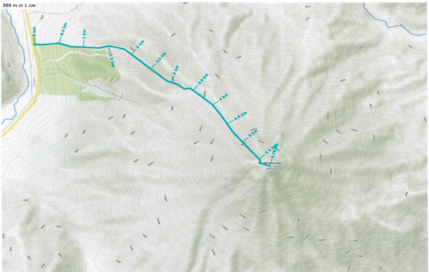
СХЕМА ТУРИСТИЧЕСКОГО КАТЕГОРИЙНОГО МАРШРУТА «ВОСХОЖДЕНИЕ НА ВИЛЮЧИНСКИЙ ВУЛКАН: ВСЕСЕЗОННЫЙ»